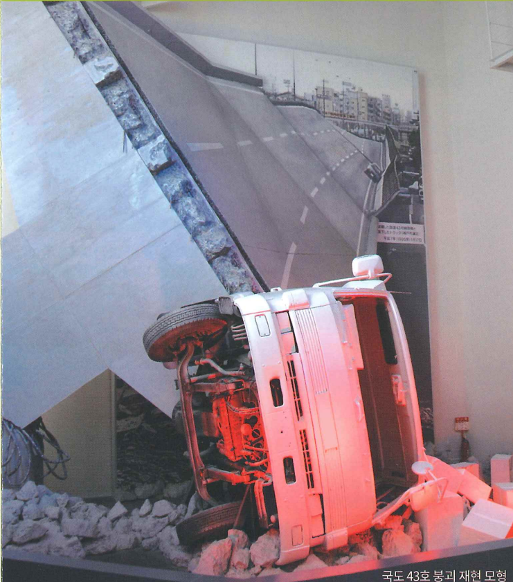
국도 43호 붕괴 재현 모형