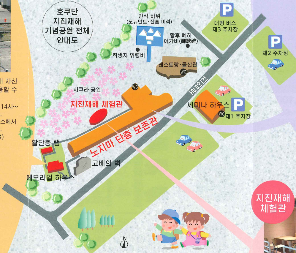
호쿠단 지진재해 기념공원 전체 안내도

국가 지정 천연기념물 노지마 단층을 그대로 실내에 보존. 파괴된 도로, 산울타리의 어긋남이나 갈라진 땅 등 단층으로 인한 다양한 지형 변화를 견학할 수 있습니다. 지면을 파 내린 트렌치 전시를 통해서도 단층에 따른 지질의 차이를 확실히 알 수 있습니다.