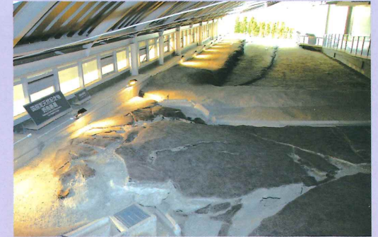
단층 보존 존

국가 지정 천연기념물 노지마 단층을 그대로 실내에 보존. 파괴된 도로, 산울타리의 어긋남이나 갈라진 땅 등 단층으로 인한 다양한 지형 변화를 견학할 수 있습니다. 지면을 파 내린 트렌치 전시를 통해서도 단층에 따른 지질의 차이를 확실히 알 수 있습니다.