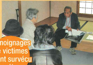
Témoignages de victimes ayant survécu au séisme

Des victimes ayant survécu au séisme offrent leurs témoignages et nous devons garder en mémoire et qui seront utiles aux futures générations.