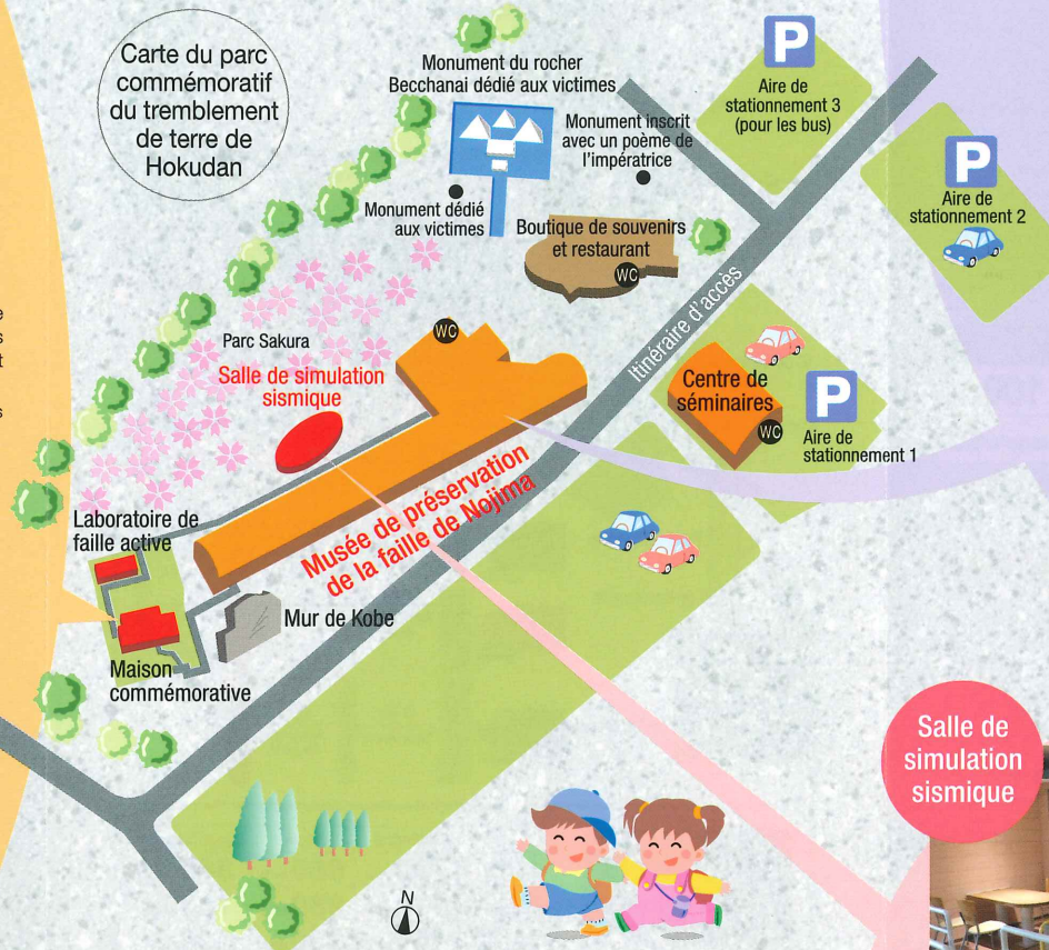
Carte du parc commémoratif du tremblement de terre de Hokudan

La faille de Nojima, monument naturel national, a été préservée in situ sous abri. Les visiteurs peuvent voir les dommages réels et les changements topographiques causés par la faille en plusieurs endroits, tels que les routes et les haies. Une section de la faille souterraine est exposée pour montrer la différence de l'état du sol avant et après le séisme.