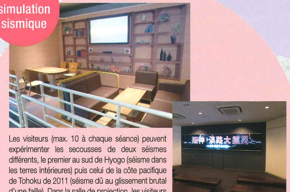
Salle de simulation sismique

Les visiteurs (max. 10 à chaque séance) peuvent expérimenter les secousses de deux séismes différents, le premier au sud de Hyogo (séisme dans les terres intérieures) puis celui de la côte pacifique de Tohoku de 2011 (séisme dû au glissement brutal d'une faille). Dans la salle de projection, les visiteurs peuvent visionner des films et des documentaires sur les séismes et les tsunamis.