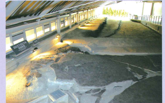
Zone de préservation de la faille

La faille de Nojima, monument naturel national, a été préservée in situ sous abri. Les visiteurs peuvent voir les dommages réels et les changements topographiques causés par la faille en plusieurs endroits, tels que les routes et les haies. Une section de la faille souterraine est exposée pour montrer la différence de l'état du sol avant et après le séisme.