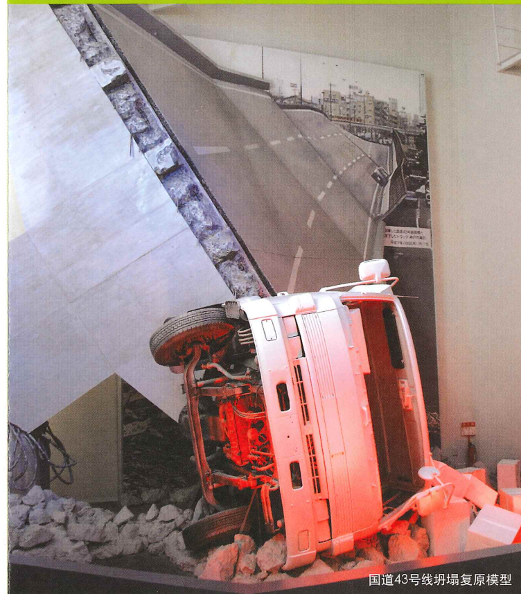
国道43号线坍塌复原模型